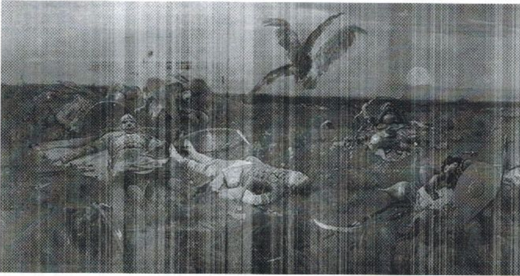
После побоища ... с половцами. Художник В.Васнецов

30. Задания по работе с иллюстративным источником. Ответьте на вопросы к иллюстрации (15 баллов).