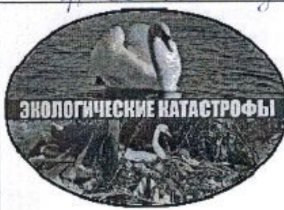
право на благоприятную эколог. среду