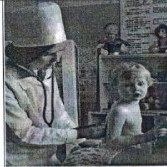
право на медицинскую помощь и охрану здоровья