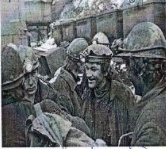
право на свободу