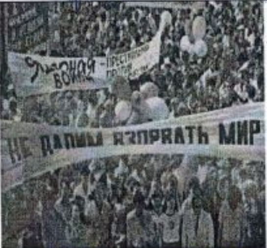
право на объединение