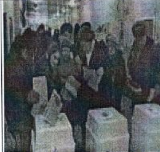
право избирать и быть избранным