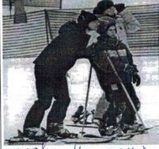
право на отдых